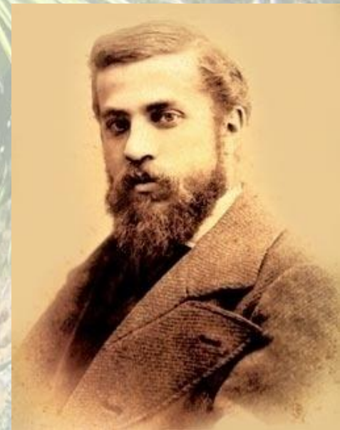
Antonio Gaudí 1852-1926