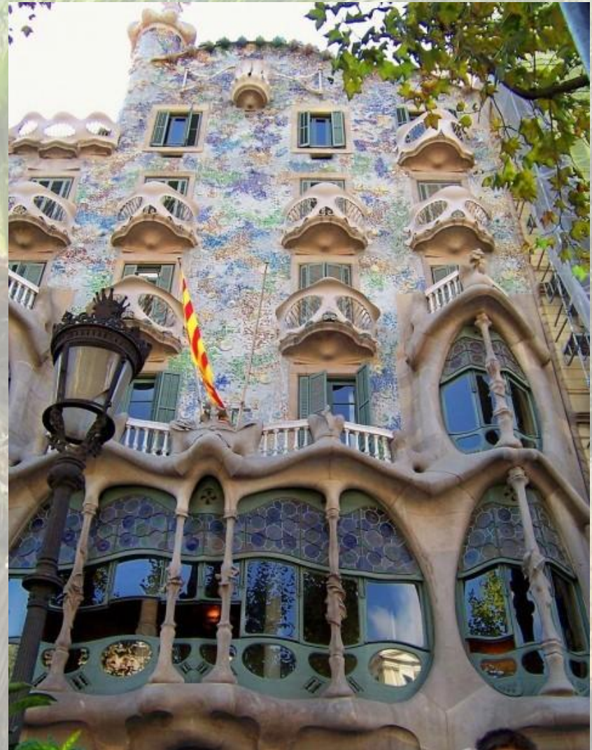
A.Gaudí: Casa Batlló