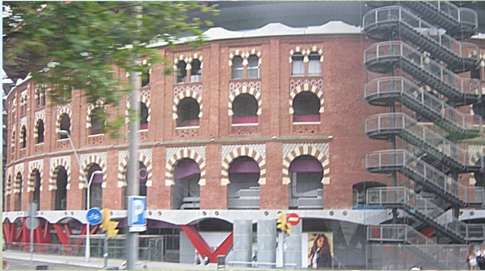
Obchodní centrum Arena.