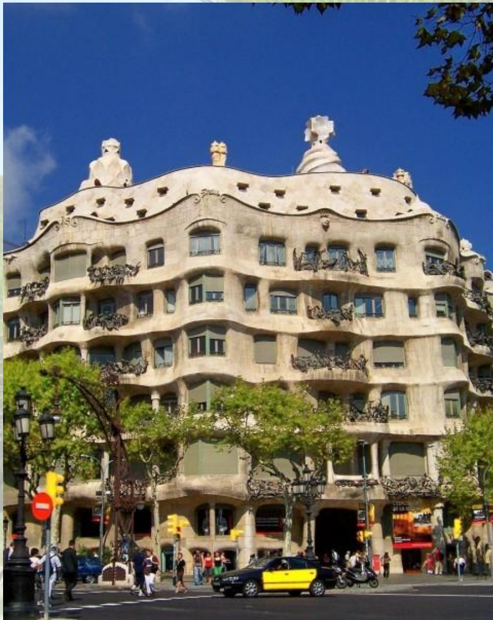
A. Gaudí: Casa Milà