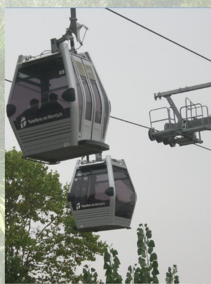
Vyhlídková lanovka na Montjuïc