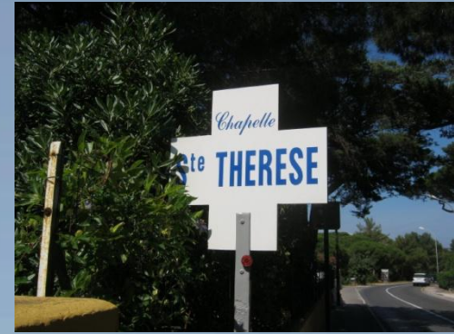
Kaple sv. | Terezy