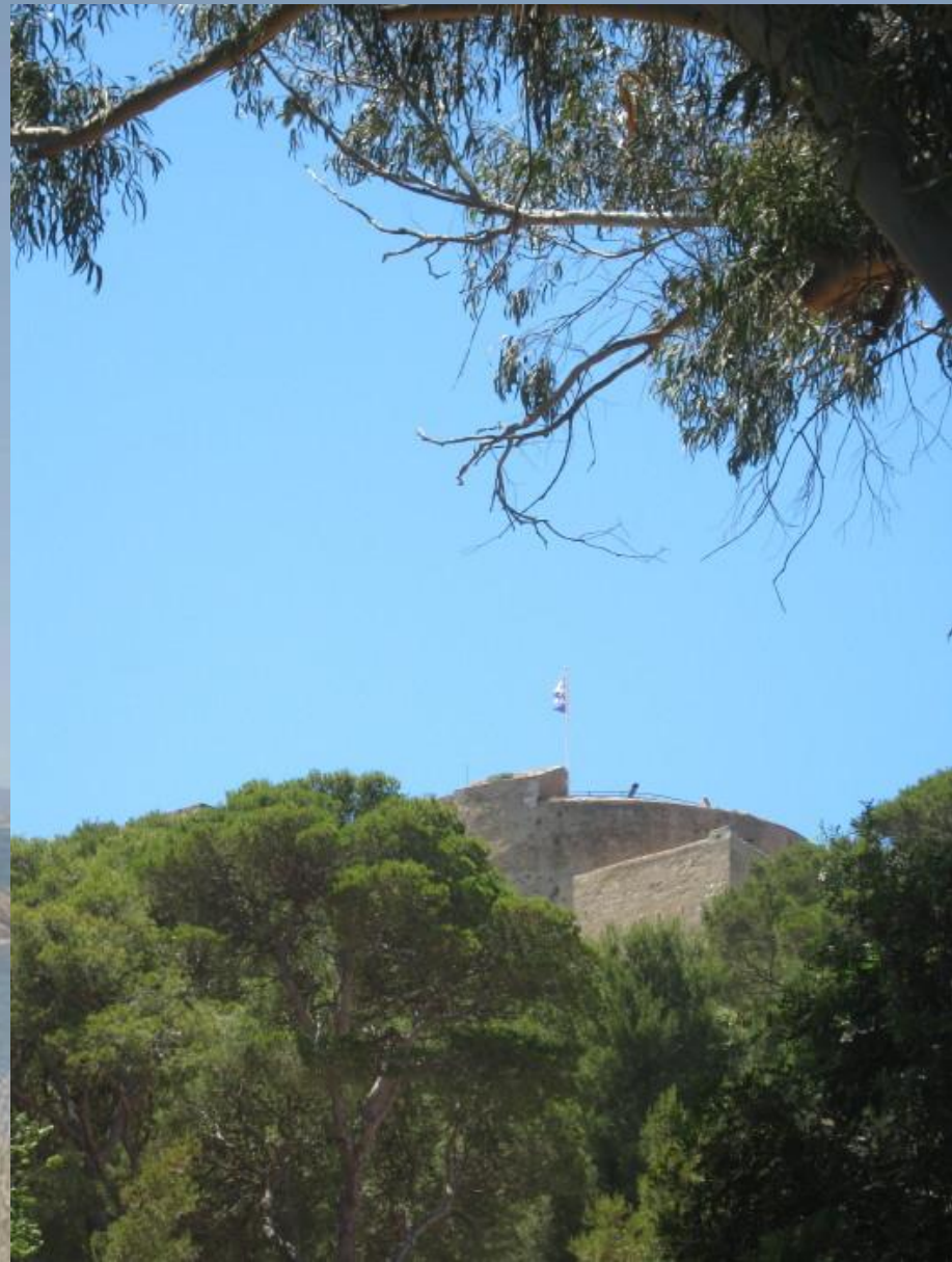
Pevnost sv. Agáty