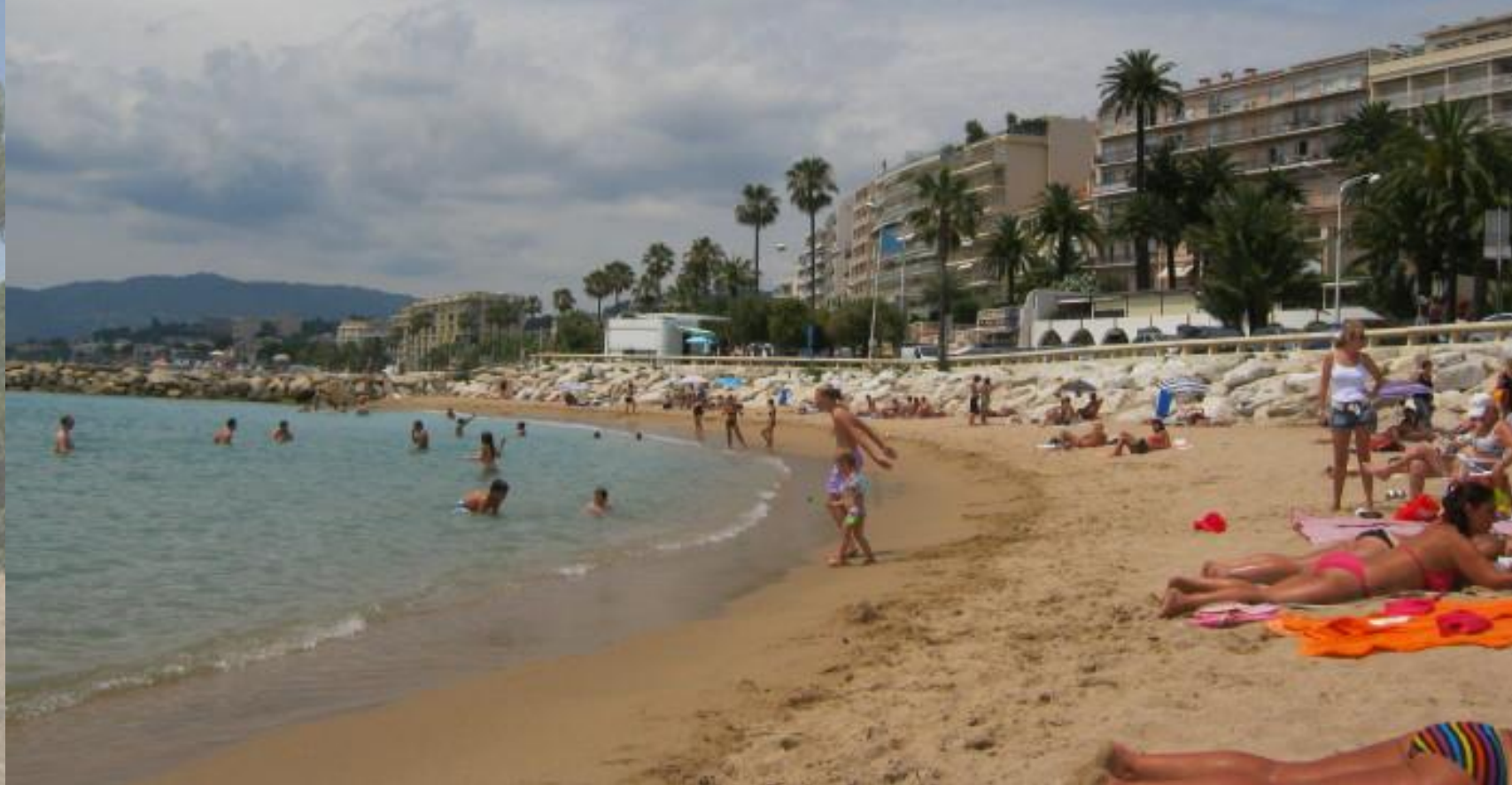
Příjemná písčité pláž v Cannes