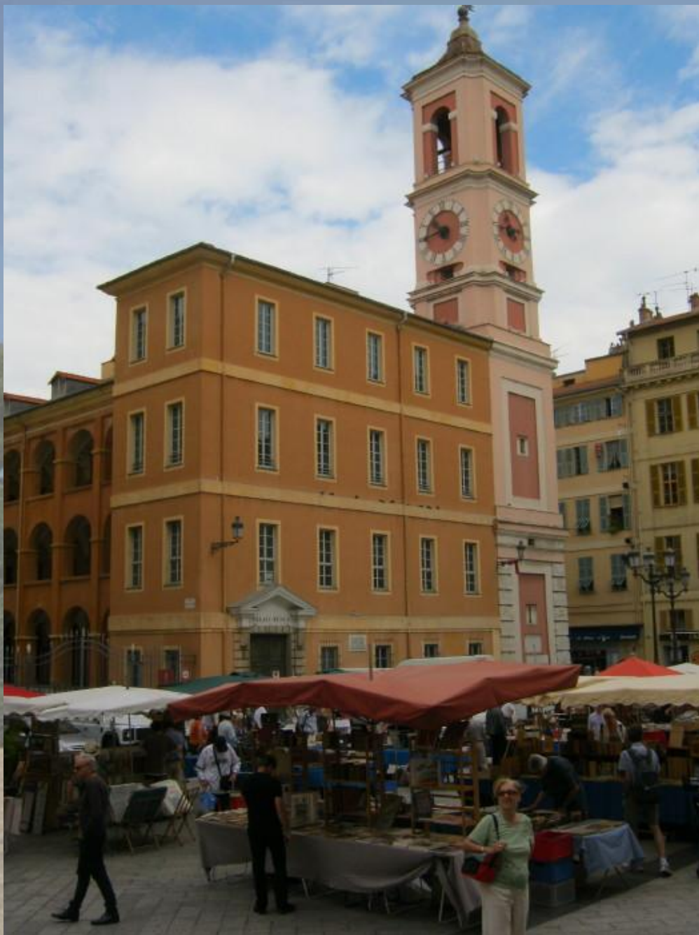
Tržnice – antikvariát u justičního paláce