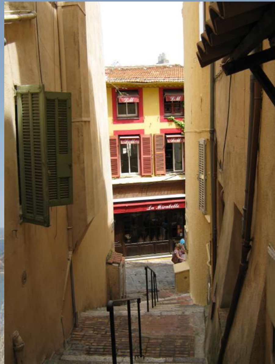
Úzké uličky historické části města