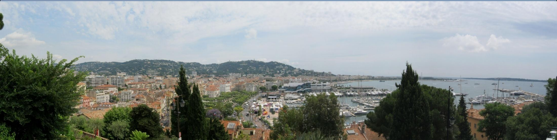
Panorama Cannes město záliv