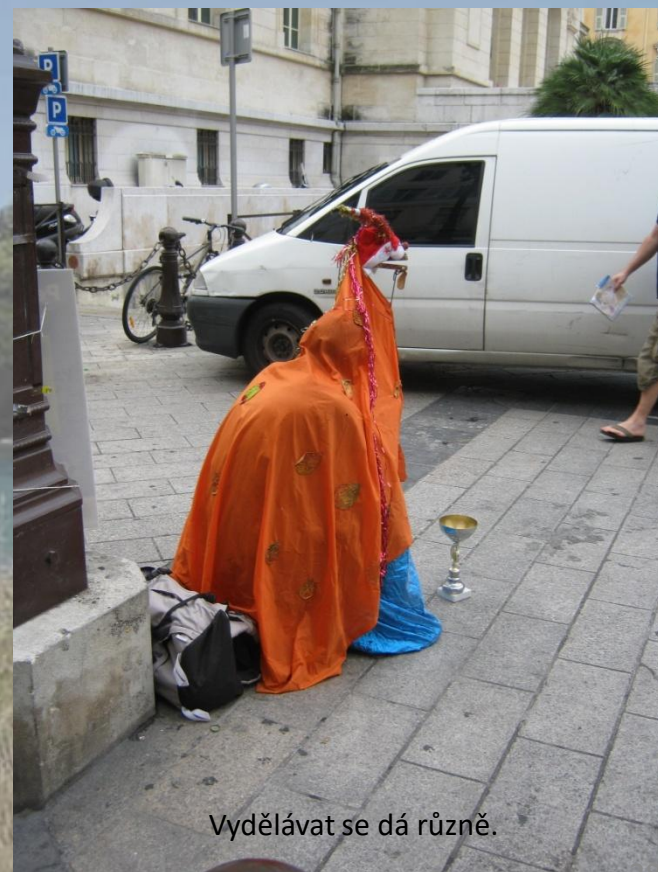
Vydělávat se dá různě.